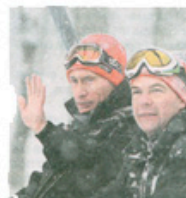
Vladimir Putin och Dmitrij Medvedev åker ofta skidor i det alpina området norr om Sotji.

Men. Varför är en hamn nödvändig just här, när alla olympiska anläggningar är utlovade att vara klara för testkörning 2012 och hamnen inte är färdig förrän samma år? Allt byggmaterial måste ändå förläas in på andra vägar. Många jagttalar med