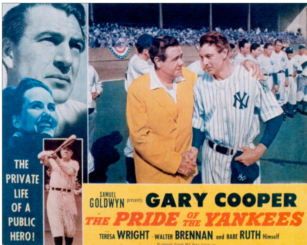
Lobby card för The Pride of the Yankees

Lou är en snäll och varmhjärtad son som gärna vill vara modern till lags, och därför börjar han studera på Columbia. Där gör han sig känd som en god baseballspelare i skollaget, och blir invald i studentföreningen där hans mor sköter köket. Det finns emellertid också de som försöker förlöjliga hans blyga bortkommenhet. När en ondsint föreningskamrat ordnar ett elakt spratt för honom i samband med en skolbal brister det för Lou, som står upp för sin stolthet och sitt egenvärde genom att slå ner honom. Lou är nu på väg att bli en man och en självständig individ, som inte låter någon sätta sig på honom.