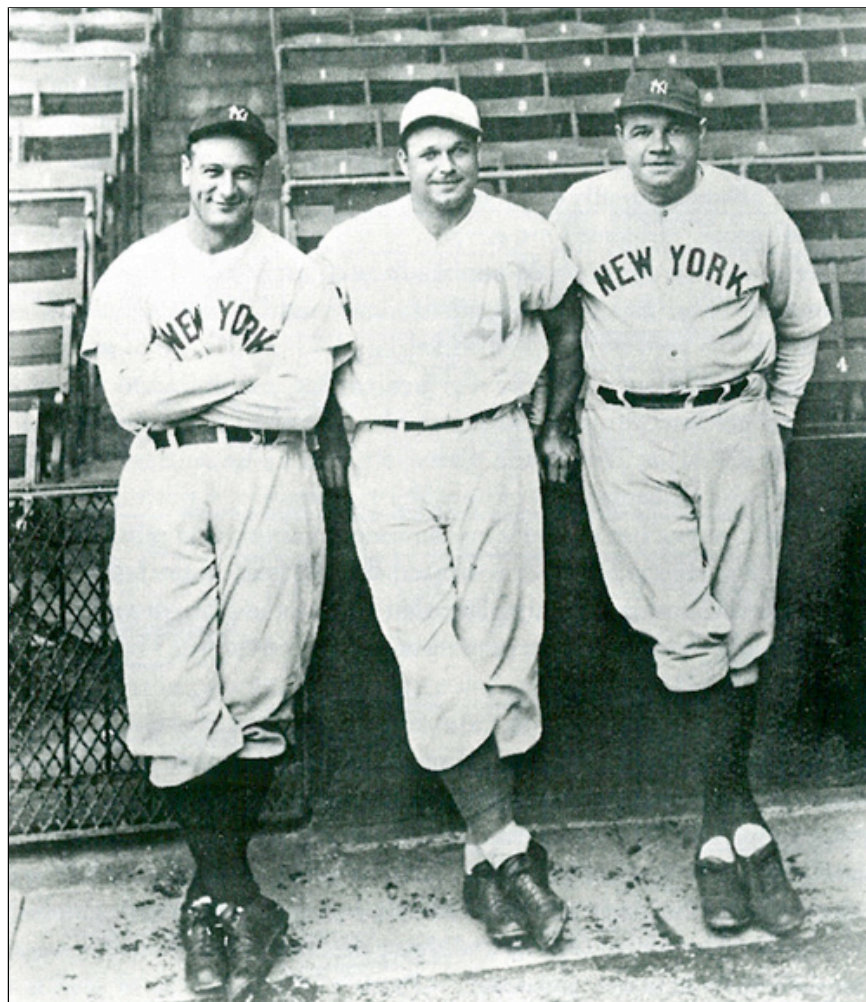
Tre firade baseballhjältar från 1930-talet. Lou Gehrig till vänster och Babe Ruth till höger flankerar Philadelphia Athletics Jimmie Foxx, som senare blev stjärna i Boston Red Sox.

Att Lou utvecklas till en självständig man som lösgör sig från moderns grepp om honom kommer även till uttryck då han "räddar" sin hustru Eleanor ur moderns klor. Modern blir inte bara avundsjuk på Eleanor, hon ska också bestämma över hur de ska inreda sitt hem. Eleanor försöker uppgivet låta henne hållas så långt det går, men då Lou märker hur nedstämd hustrun blir av hans dominerande mor talar han modern till rätta. Symtomatiskt nog får vi aldrig se eller höra denna tillrättavisning från Lous sida, huruvida den var hetsig eller inte: i enlighet med filmens mytologisering av Gehrig får vi aldrig se honom vara annat än vänlig, snäll och överseende gentemot sin mor. Ända fram till denna stilla "revolt" mot modern förhåller han sig till henne mer som ett barn än som en självständig man.