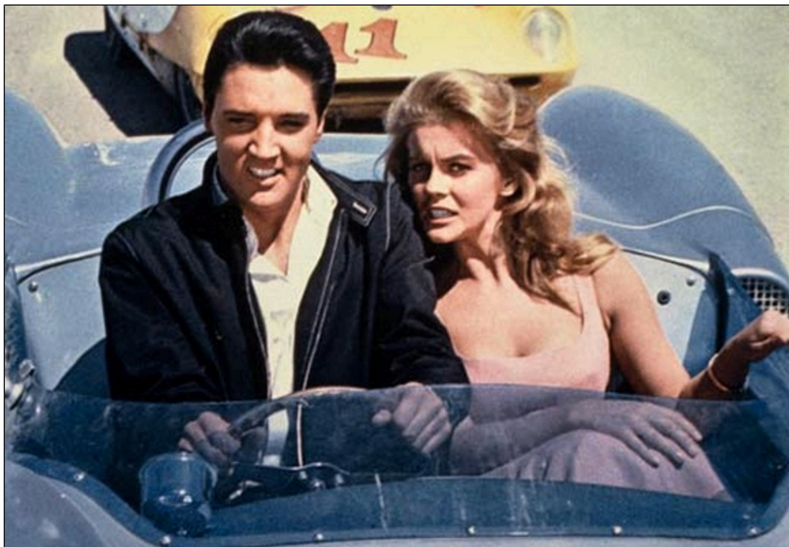
Actionladdad racerscen, med en tuff, leende Elvis och en förskrämd Ann Margret. Reklamvykort från filmbolaget.

Att bilen är Rustys främsta rival om Luckys gunst – och en rival som så att säga inte kan besegras på samma bana – framgår i scenen innan, då hon hemma i köket ordnar med matkorgen och med plutmun sjunger om att "My rival is a baby-blue racing car". Rusty kan alltså först som sist bara vinna Luckys kärlek och intresse genom att vara något annat än vad racerbilen står för, nämligen det moderliga och hushållsmässiga omhändertagandet.