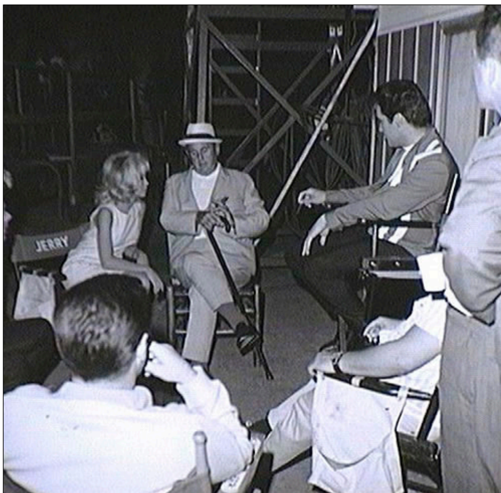
En paus under inspelningen av Speedway. Till vänster Nancy Sinatra, i mitten den ständigt närvarande "överste" Parker, och Elvis till höger.

Detta får Steve att lägga sig i hårdträning med sin bil, och vi ser honom på banan kl. 6 på morgonen tillsammans med sitt team, där alla är trötta och gäspar. När Steve kört klart och kommer in i depån säger han till en i teamet, en småväxt man med namnet Birdie (Carl Ballantine): "Run her up, Birdie." Den äldre teamchefen undrar om det är några problem med bilen, varpå Steve svarar: "Not one, man. She's really honking", varpå han nöjd klappar "henne", dvs. sin racerbil, på motorhuven (läs: magen). Teamchefen klappar Birdie i ansiktet som vore denne ett barn och säger: "Honking means she's running exceptionally well." Den till synes ovetande Birdie: "Oh...". Till saken hör, att Birdie har ett asiatiskt utseende. Han är den ende i filmen som inte är vit, som avviker etniskt i förhållande till de andra aktörerna. Birdie skildras också på ett komiskt nedlåtande sätt, i denna och i andra scener i filmen. Hans namn, Birdie, skapar också associationer till fågelburarna på Drive In A GoGo, alltså till någonting feminint och dekorativt.