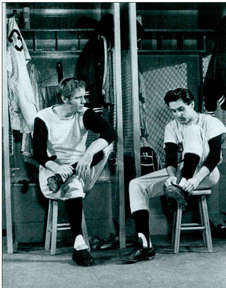
Den ovanligt nära vänskapen mellan kastaren (pitcher) Henry Wiggen (Michael Moriarty) och stopparen (catcher) Bruce Pearson (Robert De Niro) föranleder lagets manager att fråga: "What's up between you two? What are you, a couple of fairies?"

Här finns de giriga och hänsynslösa ägarna, som pressar löner och bara behåller de spelare som för tillfället kan prestera. I en minnesvärd scen förhandlar Henry om ett nytt kontrakt, och ställer som krav att även Bruce, som är på väg ut, ska få nytt kontrakt. De vägrar först, men då tränaren, efter viss tvekan, ställer sig på Henrys sida blir de tvungna att ge med sig. Därmed får Bruce en andra chans, vilket också är ett vanligt, populistiskt motiv i baseballfilm. Här finns också den farligt svekfulla och förledande kvinnan, Katie, som Bruce svärmar för och som försöker intyga Bruce att hon älskar honom, bara för att komma över hans livförsäkring – något Henry dock sätter stopp för.