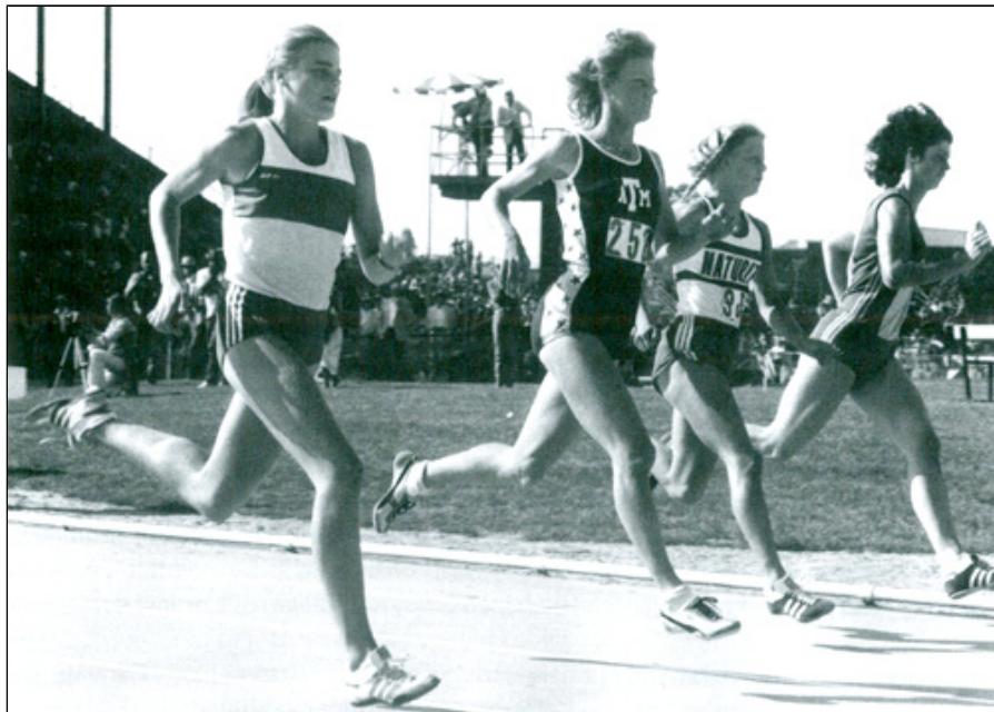
Maribel Hemingway, närmast kameran, var ordentligt tränad inför filminspelningen.