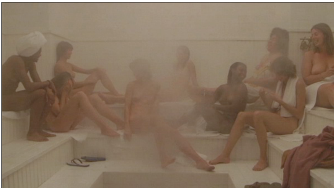
Bastubild ur Personal Best . Bilden från dvdbeaver.com , som angående DVD-utgåvan konstaterar att det är en "[s]olid dual-layered, progressive and anamorphic transfer – the type we've come to expect from Warner. There is a bit of